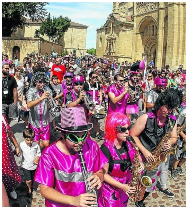
Uno de los espectáculos celebrados en la Feria de Teatro de Ciudad Rodrigo.